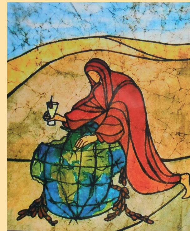
Bild: der barmherzige Samariter (Ausschnitt) von Sr. Regina Hassler ASC